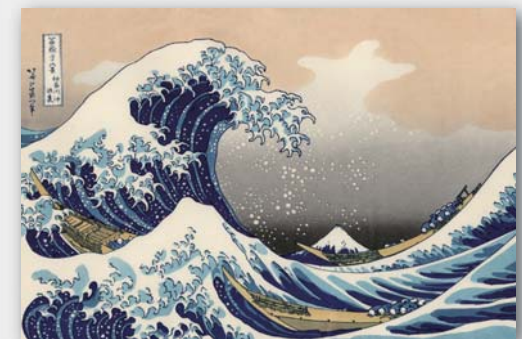
Découverte d'une estampe japonaise (Ukiyo-e)