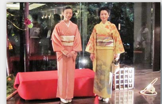
Expérience de Kimono