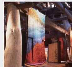
久保田一竹美術館 Kubota Itchiku Museum