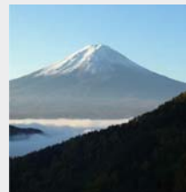
富士山・富士五湖 Mt. Fuji and Fuji Five Lakes

◆外国人のための東京レストランガイド (英語のホームページを持つレストランを調査。味、雰囲気、サービスなどを独自評価)