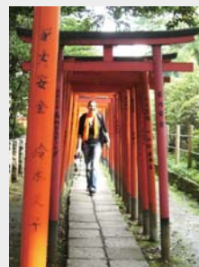
谷中・根津・千駄木 Yanaka / Nezu / Sendagi